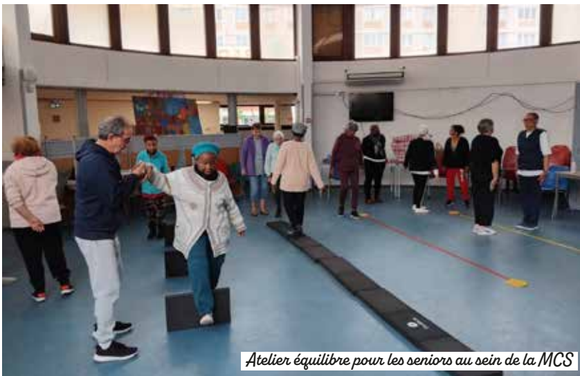
Atelier équilibre pour les seniors au sein de la MCS

plémentaires : la Croix-Rouge française, le Secours catholique, le Secours populaire et les Compagnons Bâtisseurs. Distribution de repas et de vêtements, accompagnement social, cours de français, ateliers de bricolage ou chantiers d'insertion : ce lieu est entièrement dédié aux solidarités et à l'entraide.