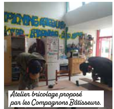
Atelier bricolage proposé par les Compagnons Bâtisseurs.

Les Compagnons Bâtisseurs sont présents avec un atelier installé à la Maison communale des solidarités. Notre association d'éducation populaire lutte contre le mal-logement en aidant les habitants à améliorer leurs conditions de vie. Nous réalisons les travaux avec eux, tout en proposant des animations collectives et des initiations au bricolage. Le fait de partager ce lieu avec trois autres associations est très positif. Chacune est représentée au sein du Conseil, ce qui permet de monter des projets communs, comme des chantiers collectifs. L'objectif est clair : développer plus d'actions ensemble, être plus visibles et permettre à davantage d'habitants de bénéficier de nos actions communes.